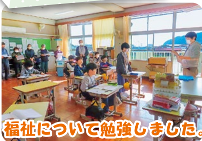
福祉について勉強しました。

三崎小学校は、子ども民生委員活動が初めての取り組みになりますが、今まで培ってきた福祉活動を中心に地域や高齢者の皆さんを元気にしていきます。