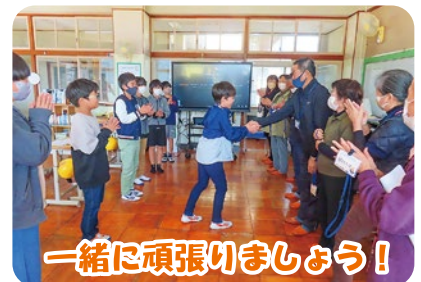
一緒に頑張りましょう!