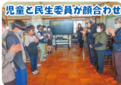
児童と民生委員が顔合わせ